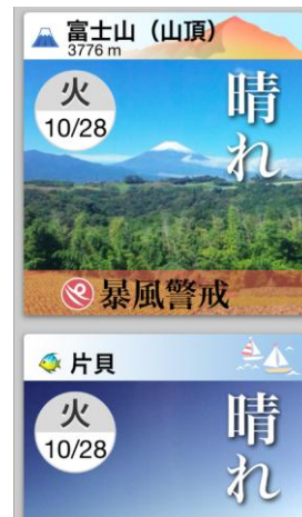
追加地点がトップ画面に表示される