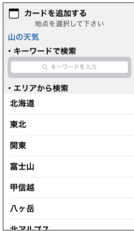
“カード&お知らせ設定” からエリア検索またはキーワード検索

スクが高まった際は、“富士山で噴火警戒に関する情報が発表されました。火口周辺には近づかないようにしてください” というようなお知らせをスマホにお届けします。ご希望の方は、“カード&お知らせ設定” へアクセスし、“お知らせを受け取る” をオンにしてください。