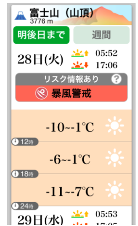
画面タップで、リスク情報や天気など詳細へ