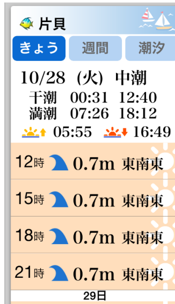
※『マリン天気』イメージ図

また、風や波の向きをマップで確認したい場合は、『マリン天気』に加えて「波・風マップ」をご覧ください。