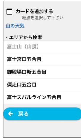
1,300カ所からお好みの地点を選択