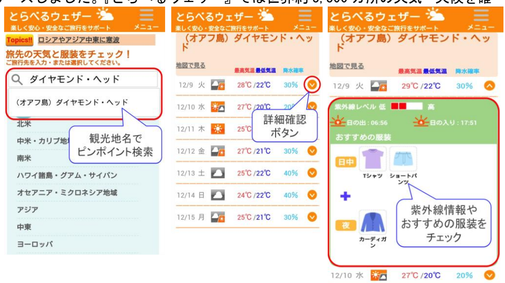
図1. スマホ版『とらべるウェザー』サンプル画面 観光名所のピンポイント天気やおすすめの手帳をチェック

さらに、主要都市だけでなく「ダイヤモンド・ヘッド」などの観光名所のピンポイント情報も確認可能なため、晴れた日に屋外の観光スポットに行く予定を立てるなど、天気に合わせて