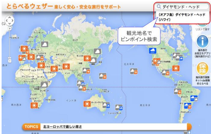
図 2. インターネットサイト『とらべるウェザー』サンプル画面 地図検索やリスト検索機能の他、 特定の観光地名でのピンポイント検索も可能