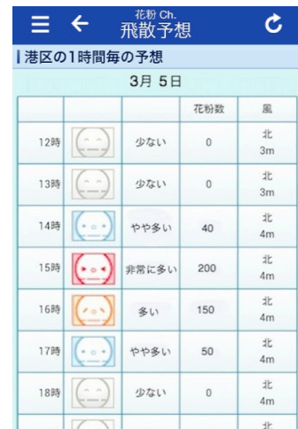
1時間ごとの花粉飛散予想

花粉は時間帯によって飛散量が変化するため、同じ日でも時間帯によって症状の強さが変わることがあります。『花粉 Ch.』では、1時間ごとの花粉飛散予想を提供しており、外出する時間帯に花粉の飛散が多いかどうかを確認することができます。また、風が強いとより多くの花粉が目や鼻に入りやすくなり、衣服にも付着するため、花粉の量がそれほど多くなくても、風が強い時は注意が必要です。『花粉 Ch.』では風向・風速の予想も公開しており、風の強さを事前にチェックすることで、風の強い日は花粉が付着しにくい服装にするなどの対策をとることができます。