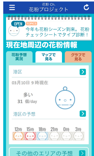
『花粉 Ch.』のトップページ サンプル画面