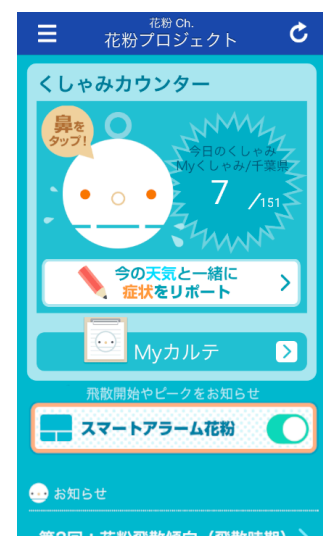
“くしゃみカウンター”のサンプル画面

“くしゃみカウンター”は、サイト上の「ポールンロボ」の鼻をタップしてくしゃみの回数をカウントするコンテンツです。自分のくしゃみの回数をカウントするほか、都道府県ごとに皆様のくしゃみの回数を合計した値が表示されます。このコンテンツは花粉症でない方も参加して楽しんでいただけます。