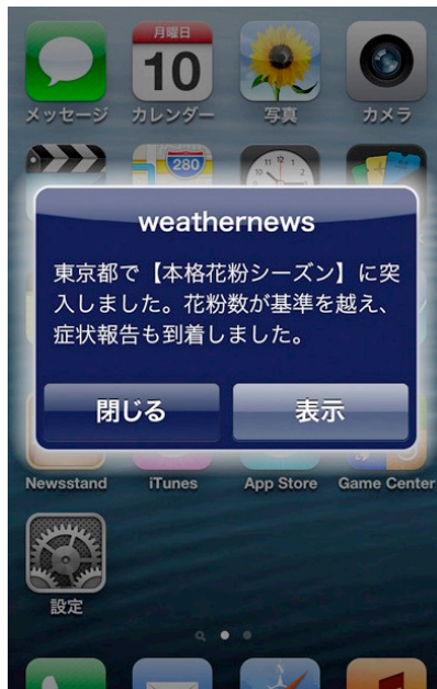
『スマートアラーム 花粉モード』 PUSH 通知のサンプル画面

『スマートアラーム 花粉モード』は、花粉シーズンの開始と終了、および飛散のピークをPUSH通知でスマホにお知らせするサービスです。GPS機能により、お出かけ先や出張先でも現在地にあわせて最新情報をお届けします。また、PUSH 通知画面の“表示”をタップすると『花粉Ch.』が表示され、1時間ごとの花粉飛散予想や最新の観測値などをご確認いただけます。