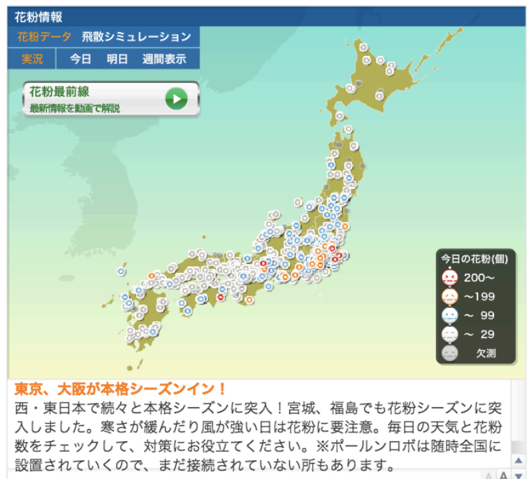
PC用インターネットサイト「ウェザーニュース」の「花粉 Ch.」

今年も、「花粉 Ch.」内の“My カルテ”と“くしゃみカウンター”をバージョンアップしました。“My カルテ”で日々の症状を報告していただくことで、症状と花粉の飛散量を記録したあなた専用のカルテを作成していきます。また、くしゃみの症状については、画面上の“ポールンロボ”の鼻をタップする“くしゃみカウンター”を通して楽しみながら記録することができます。