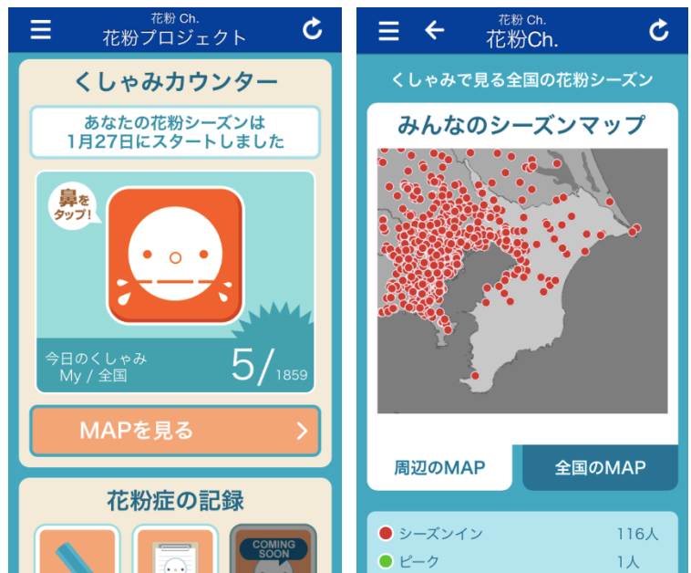
“くしゃみカウンター”

また、鼻をタップした回数は“Myカルテ”に記録されます。花粉シーズンインからくしゃみの数を計測し続けることで、シーズンが終わった後に、つらくなり始めた時期やピークを振り返ることができます。