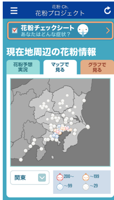
花粉観測機“ポールンロボ”による観測値のサンプル画面

花粉は時間帯によって飛散量が変化するため、同じ日でも時間帯によって症状の強さが変わることがあります。「花粉 Ch.」で1時間ごとの予想を確認することで、外出する時間帯に花粉の飛散が多いかどうかをチェックすることができます。また、風が強いとより多くの花粉が目や鼻に入りやすくなり、衣服にも付着します。「花粉 Ch.」で風向・風速の予想を確認いただき、量がそれほど多くない日でも、風が強い時はご注意ください。