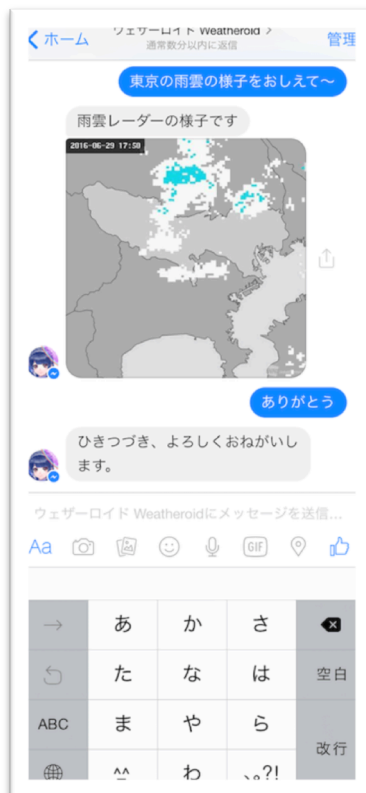
「雨雲レーダー」も搭載