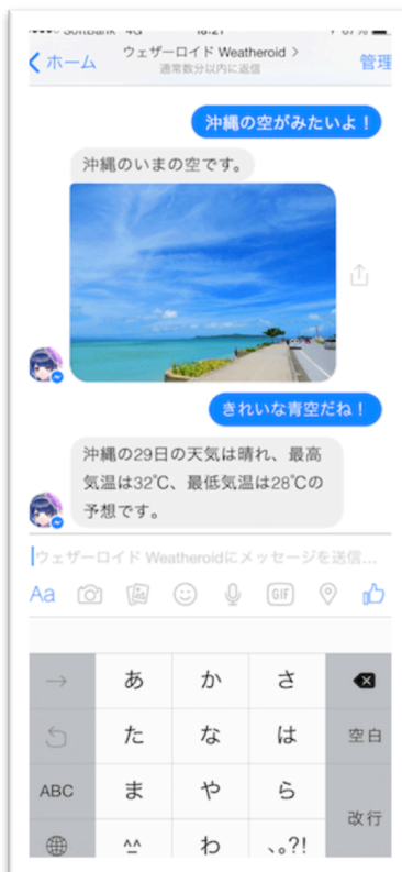
今の空の写真にも対応