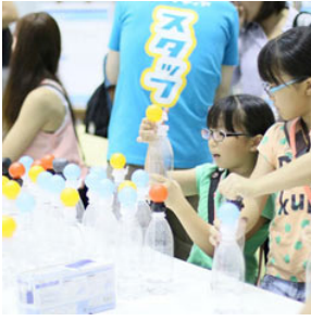
ペットボトルで雲を作る実験