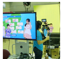
お天気キャスター体験

お天気キャスター体験 ウェザーニュースの番組で実際に使用されているカメラやクロマキー技術を使ったミニスタジオを特設。本物のお天気キャスターになりきって天気原稿を読んでもらいます。