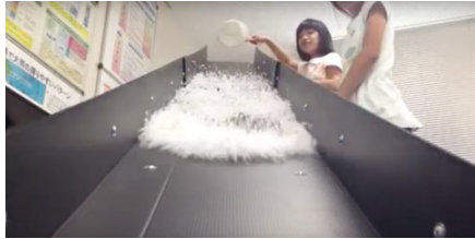
斜面に量の違うビーズを流して 雪崩の仕組みを観察