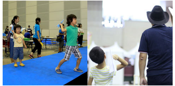
毎年大人も子どもも大盛り上がりの紙飛行機大会