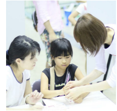
紫外線が当たると発色するビー ズを使ったプレスレット作り