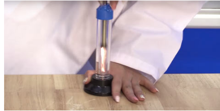
空気を圧縮して発火させる実験