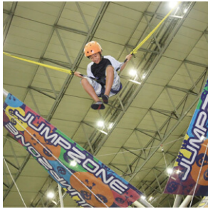
バンジートランポリン

新感覚遊具のバンジートランポリンや毎回1番の盛り上がりを見せる紙飛行機大会など、空を飛んだりはねたりして大空を体感できます。航空機の操縦が楽しめるフライトシミュレータでは、世界一着陸の難しい空港と言われていた旧・香港国際空港(啓徳空港)での操縦を体験できます。