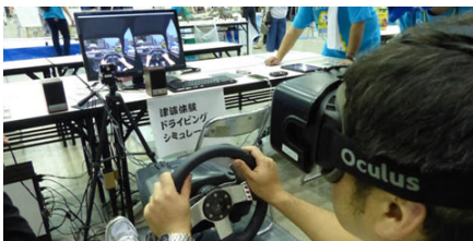
津波ドライビングシミュレータ(VR)