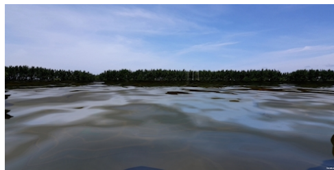
浸水疑似体験 (AR) : 実際の風景(左) ハコスコで見た風景(右)