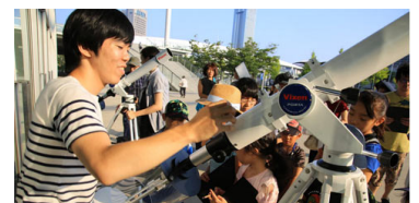
太陽の黒点を望遠鏡で観測