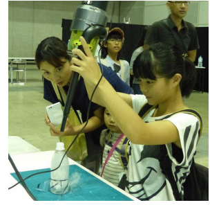
掃除機とドライアイスで 台風を再現する実験