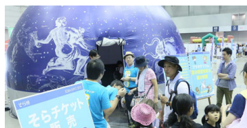
プラネタリウム観賞

直径6mの大きなプラネタリウムで綺麗な星空を楽しめるほか、株式会社ビクセンの協力により太陽望遠鏡を使い、太陽の黒点の屋外観測を行います。また、株式会社ハコスコの協力で、ハコスコを用いて星空や花火・桜など各種季節の動画によるVR体験も予定しています。