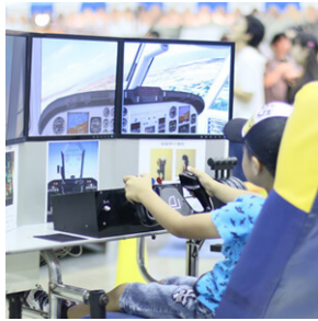
フライトシミュレータ