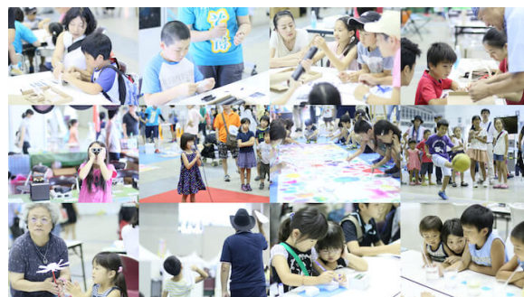
2015年のそら博の様子

ウェザーニューズのほか、気象キャスターネットワーク、子供の科学、株式会社ドクターシーラボ、気象予報士学生会、東京学芸大学などの協力で35種類の気象実験・工作を行います。夏休みの自由研究はそら博会場で完了できるよう、26種類の気象実験と9種類の工作を通じて、親子で身近な気象を楽しく学ぶことが