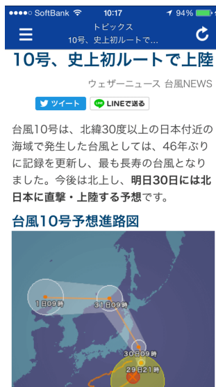
「台風 NEWS」トップページ