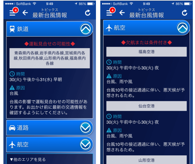
「交通影響予測」サンプル

スマホアプリ「ウェザーニュースタッチ」内「台風 Ch.」または「ウェザーニュース台風 NEWS」にある「交通影響予測」では、鉄道の遅延や運転見合わせ、道路の通行止め、航空便の遅延・欠航に関して、どの路線でいつから影響が出て、いつ再開するかをご確認いただけます。「交通影響予測」はウェザーニュースの交通気象センターが配信しており、陸・海・空の交通各社にサービスを行っている当社が提供できる独自の予測情報です。交通気象センターによると、北日本を中心に交通機関(道路・鉄道・航空)に大きな影響が予想されています。「交通影響予測」をご確認いただき、出勤・帰宅時の代替手段の検討などにお役立てください。