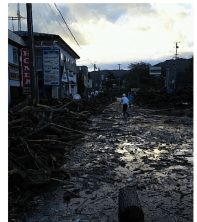
公魚さん(岩手県岩泉町) 8/31 5:27