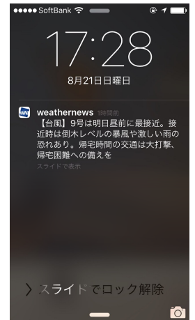
スマートアラームサンプル