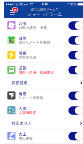
スマートアラーム設定画面

スマホアプリ「ウェザーニュースタッチ」の通知サービス「スマートアラーム」にて台風12号情報の配信を開始しました。「スマートアラーム」の“台風”の設定をオンにしておくと、GPS機能を利用し、出張先や旅行先でも自分の現在地に合わせて、台風の接近・上陸に関する情報や、雨・風の強さ、交通機関への影響など、どこよりも詳しいピンポイントの台風情報を受け取ることができます。8月は台風ラッシュとなりましたが、大きな被害をもたらす台風は9月に来ることが多いです。本格的な台風シーズンは10月まで続きますので、ぜひ今のうちにご登録ください。