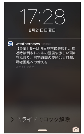
スマートアラームサンプル