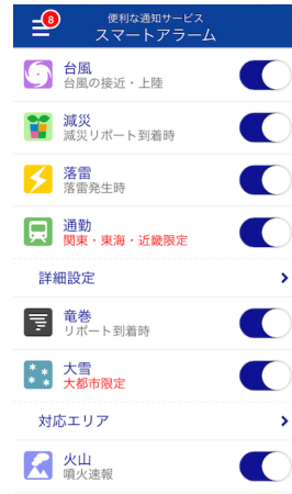
スマートアラーム設定画面

スマホアプリ「ウェザーニューズタッチ」の通知サービス「スマートアラーム」にて台風 16 号情報の配信を開始しています。「スマートアラーム」の“台風”の設定をオンにしておくと、GPS 機能を利用し、出張先や旅行先でも自分の現在地に合わせて、台風の接近・上陸に関する情報や、雨・風の強さ、交通機関への影響など、どこよりも詳しいピンポイントの台風情報を受け取ることができます。今回の台風 16 号で台風の上陸は約 1 か月で 6 つ目となりました。1 年に上陸した数としては 2004 年(10 個)に次ぐ多さです。16 号が去っても、台風シーズンは 10 月まで続きます。特に秋の台風は日本に上陸しやすいコースをとり、過去に大きな被害をおよぼしたものが多いため、ぜひ今のうちにご登録ください。