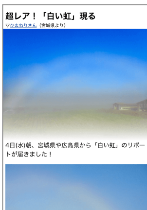
ユーザーによる“白い虹”スクープ写真+気象解説