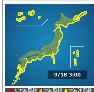
津波発生時の詳細解説