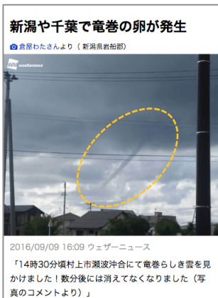
ユーザーからの“竜巻”スクープ写真+注意情報

今回、新たに「SmartNews」への配信を通じてさらに多くの方々に気象情報が届くようになることで、災害による被害が最小限に抑えられるよう、また空や天気を楽しむ輪が広がるよう、ウェザーニュースは役立つ情報を発信していきます。