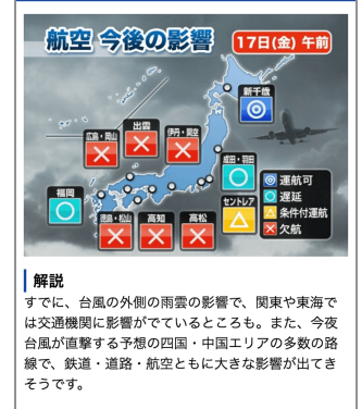
交通への影響予測を解説