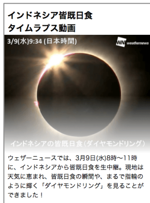
皆既日食を動画で振り返り