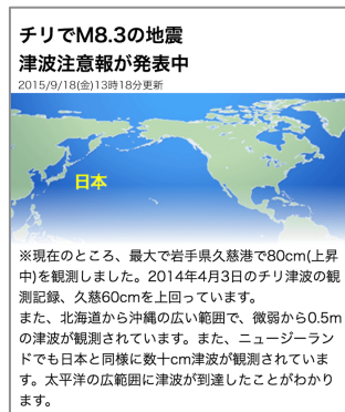
津波注意報発表のエリア