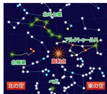
1月4日3時の放射点の位置(東京)

「しぶんぎ座流星群」は、活動が活発な期間が数時間と短く、流星の出現数が年によって変化するのが特徴です。出現のピークの予想と実際に観測で