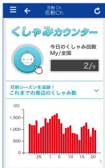
“くしゃみカウンター”(サンプル)

「花粉 Ch.」の“くしゃみカウンター”は、画面上の「ポールンロボ」をタップしてくしゃみの回数をカウントするコンテンツです。周辺にくしゃみデータの日変化がグラフで表示でき、一週間通してどのタイミングでくしゃみが多くなっているのが簡単にわかります。また、「ポールンロボ」をタップした回数は“My カルテ”に記録されます。花粉シーズン中、くしゃみの数を計測し続けることで、シーズン終了後につらくなり始めた時期や症状のピークを振り返ることができます。