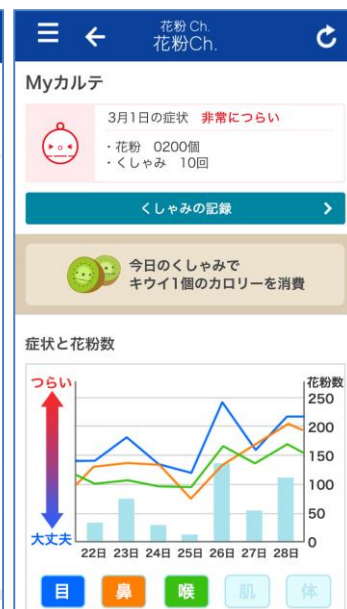
“My カルテ” (サンプル)

“My カルテ”を初めて利用する時は、花粉症のタイプを判定するために“花粉チェックシート”が表示されます。症状を入力すると、過去のユーザーの症状データをもとにあなたの花粉症のタイプが自動判定されます。くしゃみ・鼻水・鼻づまり・目のかゆみ・肌のかゆみ・のどの痛みの6項目の症状の程度がレーダーチャートで表示され、あなたの花粉症はどの症状が強くなるタイプなのかがひと目でわかります。