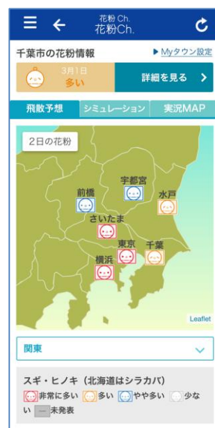
ウェブサイト「花粉 Ch.」トップ (サンプル)