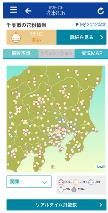
花粉観測機「ポールンロボ」による花粉実況(サンプル)

「花粉 Ch.」は、花粉観測機「ポールンロボ」が観測した花粉のリアルタイムな飛散量や、1時間ごとの花粉飛散予報をチェックできる花粉対策コンテンツです。花粉は時間帯によって飛散量が変わるため、同じ日でも症状に強弱が出ることがあります。「花粉 Ch.」で1時間ごとの予報を確認することで、外出する時間帯に花粉の飛散が多いかどうかを把握できます。また、風が強いとより多くの花粉が目や鼻に入りやすくなり、衣服にも付着します。「花粉 Ch.」の風向・風速の予報で、どの時間帯が一番注意が必要なのかを確認し、事前対策にお役立てください。自宅や職場など、花粉飛散予報を常にチェックしておきたい地点がある場合は“My タウン設定”をしておく、「花粉 Ch.」を起動してすぐに確認することができるため、大変便利です。