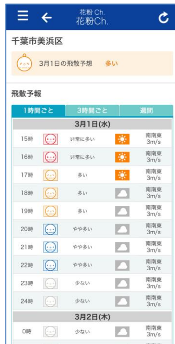
1時間ごとの花粉飛散予想(サンプル)

なお、今後新たに“花粉シミュレーション”の公開を予定しており、花粉がスギやヒノキ林といった発生源から風に流されて飛散する様子をシミュレーションした結果をサイトで確認できるようになります。“花粉シミュレーション”は、全国に設置を進めている花粉観測機「ポールンロボ」で観測された花粉飛散量のデータを参考に計算され、24時間先までの花粉飛散予想量を1時間ごとに色の濃淡によって表示します。これにより、飛散が多い場所、時間帯がひと目でわかり、迫ってくる花粉に備えて事前に対策を取ることができます。(公開は2月上旬を予定)