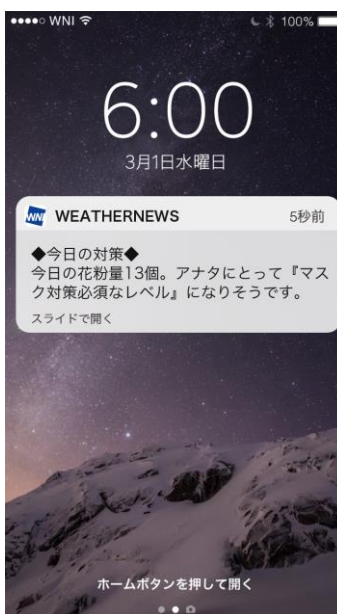
『花粉対策アラーム』イメージ

『花粉対策アラーム』は、毎朝6時にあなたの症状に合う花粉対策と予想飛散量をスマホにプッシュ通知で届けるサービスです。くしゃみ・鼻水・鼻づまり・目のかゆみ・肌のかゆみ・のどの痛みの6項目の入力情報から割り出されたあなたの症状の種類・程度のデータをもとに、当日の予想飛散量も考慮し、その日のおすすめの花粉尘対策をお知らせします。GPS機能を利用し、あなたの居場所に合わせて情報をお届けするので、出張先などでも万全な花粉対策ができます。また毎朝以外にも、花粉が大量飛散した場合や花粉シーズン・本格花粉シーズンに突入した時は、臨時情報としてお知らせします。花粉症には早めの対策が効果的とされているため、スマホアプリ「ウェザー