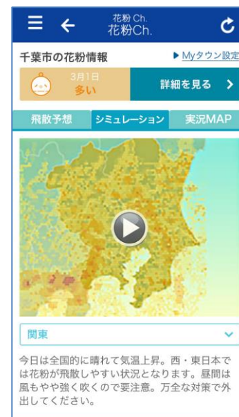
“花粉シミュレーション”(サンプル)

なお、今後新たに“花粉シミュレーション”の公開を予定しており、花粉がスギやヒノキ林といった発生源から風に流されて飛散する様子をシミュレーションした結果をサイトで確認できるようになります。“花粉シミュレーション”は、全国に設置を進めている花粉観測機「ポールンロボ」で観測された花粉飛散量のデータを参考に計算され、24時間先までの花粉飛散予想量を1時間ごとに色の濃淡によって表示します。これにより、飛散が多い場所、時間帯がひと目でわかり、迫ってくる花粉に備えて事前に対策を取ることができます。(公開は2月上旬を予定)