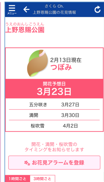
『お花見アラーム』をタップした後は名所の詳細情報へ