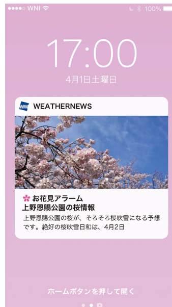
『お花見アラーム』サンプル

今年の桜の開花時期は、西～東日本では例年並～やや遅く、北日本では例年並～やや早い予想で、熊本城(熊本県)や高知公園(高知県)が3月22日、清水寺(京都府)は30日に開花の見通しです。東京の上野恩賜公園は3月23日に開花、27日に五分咲き、30日に満開、4月2日に桜吹雪の予想です。『お花見アラーム』を活用して、桜のベストタイミングに春の旅ができるようお役立てください。 ※「第一回桜開花予想」のプレスリリースはこちら( https://jp.weathernews.com/news/15661/ )をご確認ください。