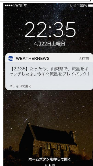
『流星キャッチャー』 通知画面サンプル

『流星キャッチャー』は、中継で捉えた流星の動画が3分以内にスマホにプッシュ通知が届くサービスで、スマホアプリ「ウェザーニューズタッチ」の『星空 Ch.』から登録できます。22日21～24時は、ウェザーニューズのスタッフが全国7ヶ所の流星中継映像をモニタリングし、流星が確認されると同時に動画を編集して、登録している方のスマホにプッシュ通知でお届けします。プッシュ通知から開いた画面では、流星の動画をすぐにご覧いただけ、どこにいても流星観測ができます。『流星キャッチャー』の対象エリアは、“全国”または“このエリア周辺のみ”から選択できます。北日本や太平洋側のエリアなど、「こと座流星群」が出現ピークを迎える22日夜に雲が広がる予想のエリアにお住まいの方は、設定を“全国”にしておくのがおすすめです。