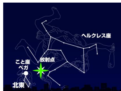
22 日 21 時頃の北東の空(東京)

今年の出現ピークは 22 日 21 時で、23 日明け方までが見頃となります。月が昇ってくるのは 23 日 3 時頃で、細い月のため、月明かりの心配はありません。このため、晴れるエリアでは今年は好条件で「こと座流星群」を楽しむことができます。