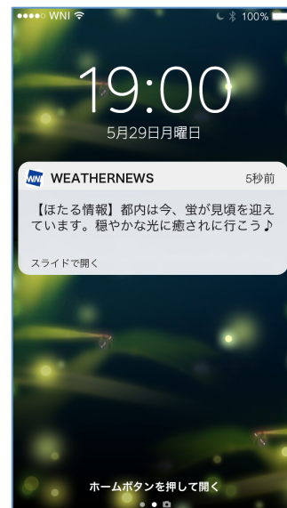
『ほたるのヒカリ』通知サンプル

ほたるの見頃はたった2週間しかない上に、出現タイミングは気象条件にも左右されます。このため、全国のユーザーから寄せられる報告を元に各地の出現状況を把握し、出現しやすい気象条件(蒸し暑い、曇っている、風が弱い、月明かりがない)を加味して、都道府県ごとに観賞に最適なタイミングをお知らせします。はかなくも美しい瞬間を逃さないよう、本サービスを事前に登録しておくで便利です。