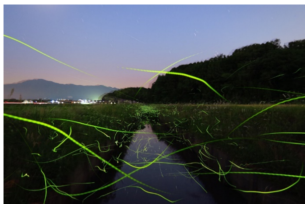
※ほたるのウェザーレポート

※“ほたる前線マップ”は、全国のユーザーから届くほたるの目撃報告をもとに、毎週更新予定です。