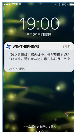
『ほたるのヒカリ』通知サンプル

ほたるの見頃はたった2週間しかない上に、出現タイミングは気象条件にも左右されます。このため、全国のユーザーから寄せられる報告を元に各地の出現状況を把握し、出現しやすい気象条件(湿気を感じる、曇っている、風が弱い、月明かりがない)を加味して、都道府県ごとに観賞に最適なタイミングをお知らせします。北陸や関東北部、北日本の方は、はかなくも美しい瞬間を逃さないよう、本サービスを事前に登録しておくとう便利です。