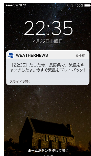
『流星キャッチャー』通知画面サンプル

『流星キャッチャー』は、中継で捉えた流星の動画が 3 分以内にスマホにプッシュ通知で届くサービスで、スマホアプリ「ウェザーニュースタッチ」の「星空 Ch.」から登録できます。「オリオン座流星群」の中継時間帯(21 日 21～23 時)は、ウェザーニュースのスタッフがハワイを含む国内外計 5 か所の流星中継をモニタリングし、流星が確認されると同時に動画を編集して、登録している方のスマホにプッシュ通知でお届けします。プッシュ通知から開いた画面では、流星の動画をすぐにご覧いただけ、どこにいても流星観測ができます。『流星キャッチャー』の対象エリアは、“全国”または“このエリア周辺のみ”から選択できます。(ハワイの流星動画は“全国”の設定で受信できます。)