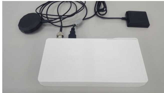
図5. 機内持ち込み型のヘリコプタ動態管理システム 「FOSTER-CoPilot」