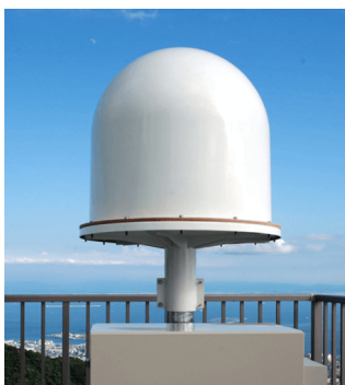
図1. 気象観測レーダー「WITHレーダー」

過去10年に発生した航空事故の約5割が小型機とヘリコプタによるものです。近年、ゲリラ豪雨や竜巻、短時間強雪など局地的で激甚な気象現象が多数発生しており、従来の気象観測データだけでは不十分な場合があります。従来の観測網では捉えることが難しい局地的・突発的な気象現象を検知するため、当社は独自に気象観測レーダー「WITHレーダー」(図1,2)や航空用ライブカメラ「峠の茶屋」(図3,4)などの観測インフラを開発・整備してきました。また、2012年以降は機内持ち込み型のヘリコプタ動態管理システム「FOSTER-CoPilot」(図5)を開発し、飛行中の小型機の位置情報の取得ならびに、地上と機上の双方向通信を実現しました。本論文では、更なる安全運航支援を実現するため、独自観測インフラの活用事例および有効性について報告しています。