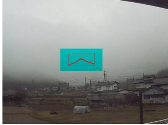
図4. 異なる気象条件下での「峠の茶屋」 (左) 晴天時、(右) 悪天時 中央の山を対象物に設定した画像解析で視界不良を自動検知