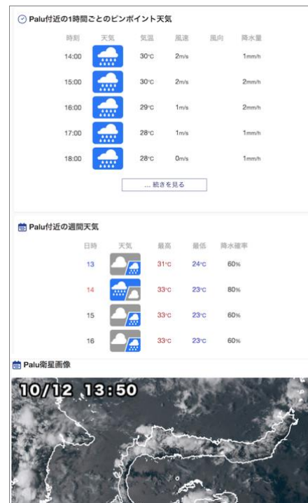
特設サイトトップページ（サンプル）