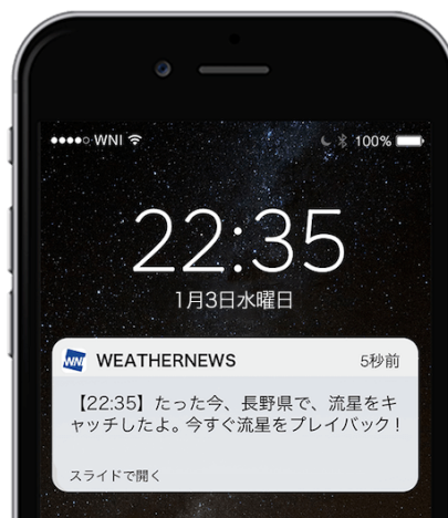
『流星キャッチャー』サンプル

プッシュ通知から開いた画面では、流星の動画をすぐにご覧いただけ、どこにいても流星観測ができます。『流星キャッチャー』の対象エリアは、“全国”または“このエリア周辺のみ”から選択できます。