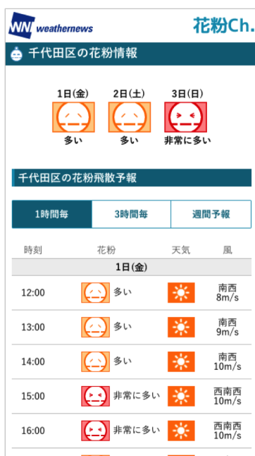
1時間ごとのピンポイント飛散予報(イメージ)

スマホアプリ「ウェザーニュースタッチ」やウェブサイト「花粉 Ch.」( https://weathernews.jp/s/pollen/ )