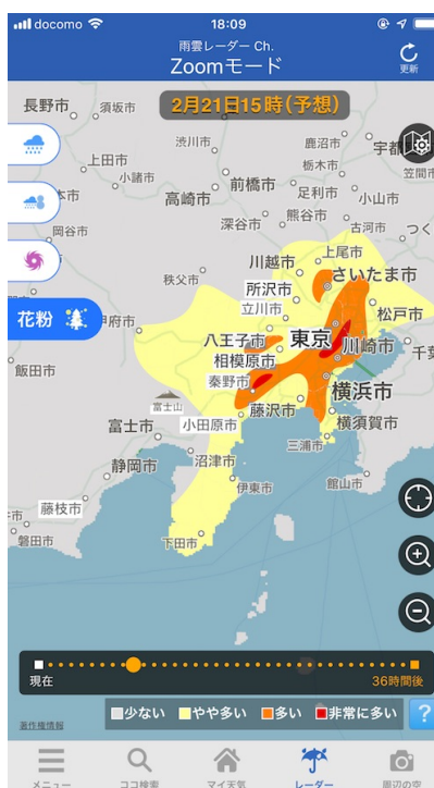
“花粉モード”で“多い”“非常に多い”エリアが一目で分かる(イメージ)

現在、関東や九州北部などで花粉の飛散が本格化しており、この先一週間の花粉飛散量は、西・東日本の各地で“多い”“非常に多い”予想となっています。今後、西・