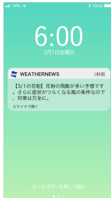
花粉対策アラーム(イメージ)