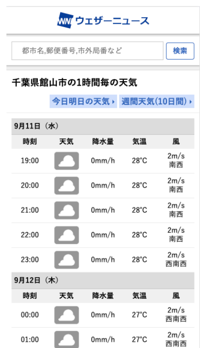
ピンポイント天気予報(サンプル)