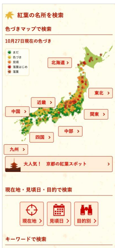
「紅葉 Ch.」TOP 画面

スマホアプリ「ウェザーニュース」やウェブサイト「紅葉 Ch.」( https://weathernews.jp/s/koyo/ )