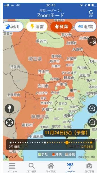
見頃時期を 250m 単位で予想(サンプル)