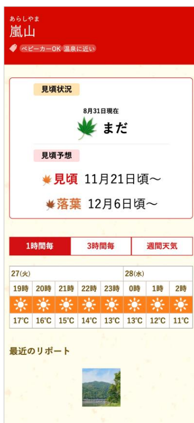
名所ごとの詳細情報 サンプル