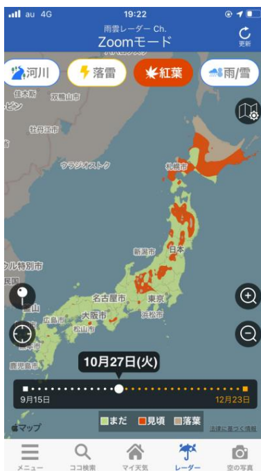
“紅葉レーダー”で“見頃”“落葉”エリアがひと目で分かる(サンプル)

なお、“紅葉レーダー”は、アプリの全画面に設けた、最下部のボタン(タブ)のレーダーアイコンからご利用いただけます。どの画面からも 1 タップで簡単にアクセスが可能です。