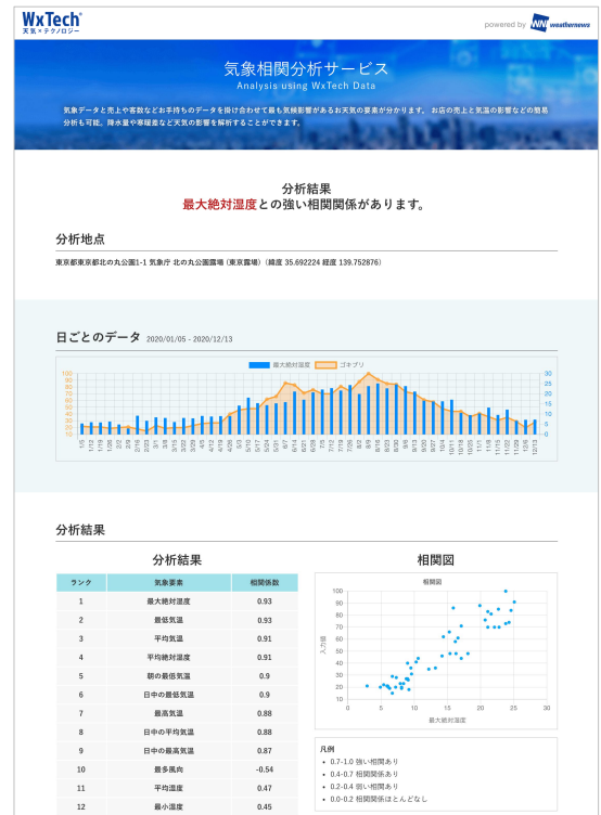
ゴキブリの検索数と気象の分析結果

ウェザーニュース独自の高精度かつ高解像度な気象データと、2,500社に及ぶお客様へのサービス導入のノウハウを活かし、業務の効率化や最適化、ビジネスリスク/ロスの低減など、持続可能なビジネスの実現だけでなく、利益の最大化や新たなビジネスチャンスの創出、マーケティング戦略の支援など、攻めのビジネスの実現をサポートします。