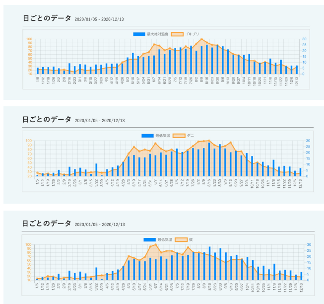
ゴキブリの検索数と最大絶対湿度(上)、 ダニと最低気温(中)、蚊と最低気温(下)のグラフ

その結果、2020年の気象データと相関が高かった検索ワードは、1位ゴキブリ、2位ダニ、3位蚊、4位虫となり、虫に関連するワードが上位を占める結果となりました。一般的にゴキブリの