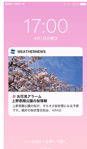
「お花見アラーム」サンプル