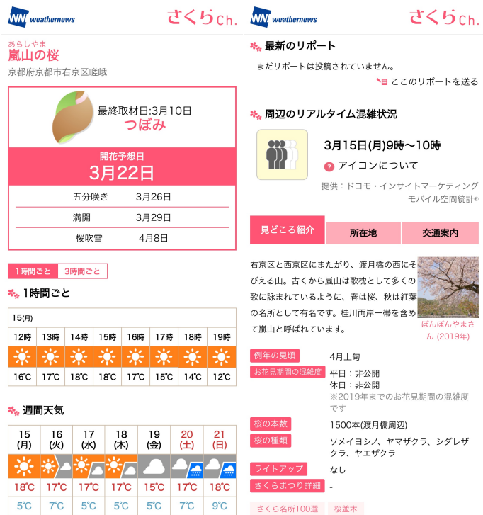
「さくら Ch.」スポット情報

先週 11 日に全国に先駆けて広島から桜の開花がスタートし、東京でも 14 日に開花を迎えました。今年の開花時期は全国的に平年より早い予想で、記録的な早さとなることもありそうです。桜は開花から 1 週間前後で満開を迎えるため、見頃も早くなりそうです。新型コロナウイルス感染拡大防止の観点から、例年のような桜の楽しみ方はできませんが、通勤通学や近所へ散歩に出かける際など、見頃の桜に出会う機会に「桜レーダー」や「さくら Ch.」をお役立てください。