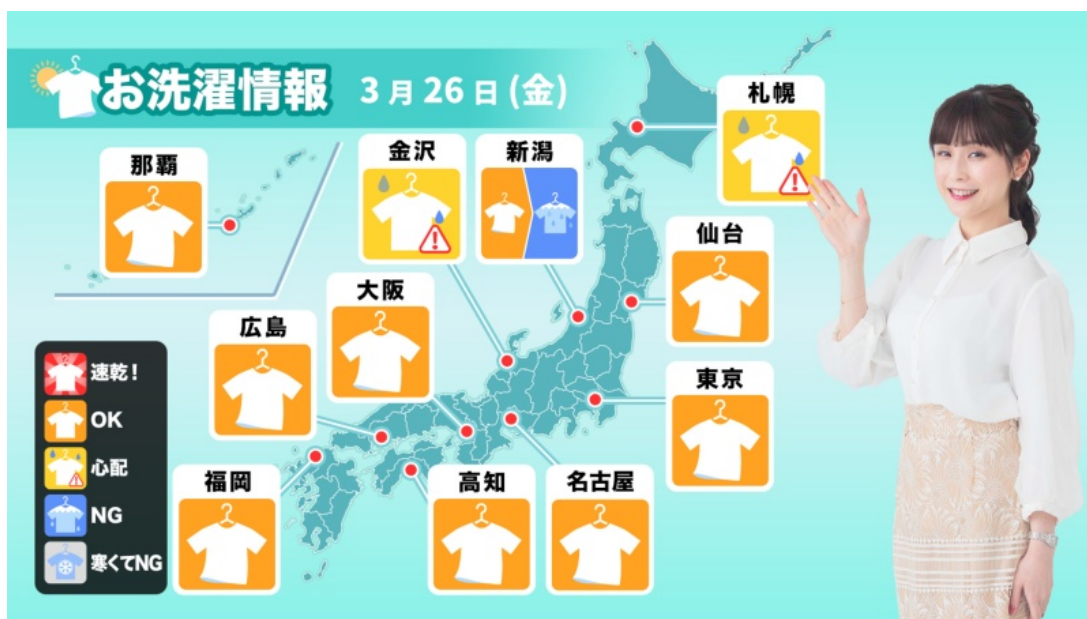
「お洗濯情報」(松雪キャスター)

視聴はこちらから: https://www.youtube.com/user/weathernews