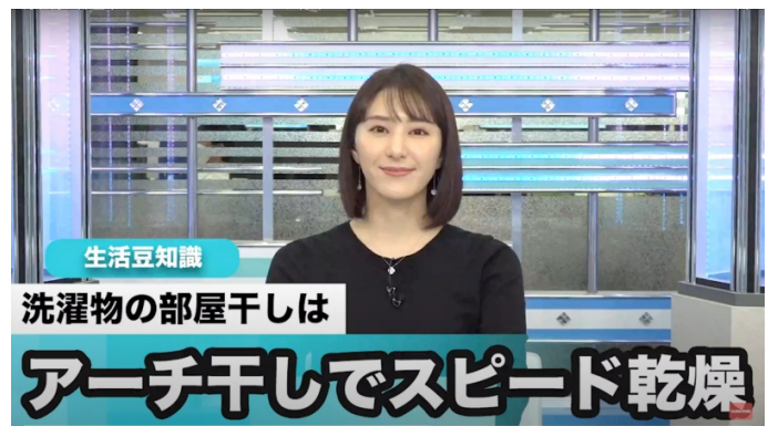
知っているのと得する“生活豆知識”を紹介

「ウェザーニュース LIVE」では、気象・防災情報に加えて、視聴者の皆さまの生活に役立つ情報も配信しています。洗濯物がいつもより早く乾く干し方や、洗濯物についてのイヤなニオイを取る方法など、知っているのと得する洗濯に関する豆知識も、動画でお伝えします。