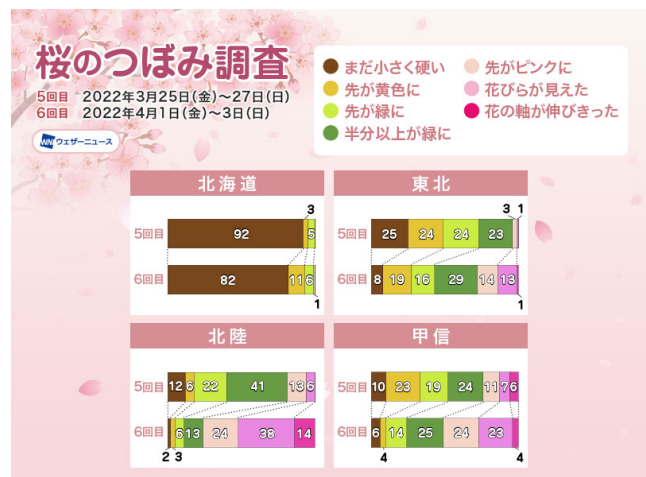
全国の桜の生長状況

この先一週間、北日本の天気は周期的に変化します。寒さが戻る日もありますが、週末は春の暖かさとなる予想です。気温が低い日はつぼみの生長が足踏みしますが、気温が上がる日には遅れを取り戻すように生長します。来週にかけて東北南部のつぼみは次々と開花を迎えます。東北北部からも開花の報告が届き始め、北海道でもつぼみに変化が見られそうです。