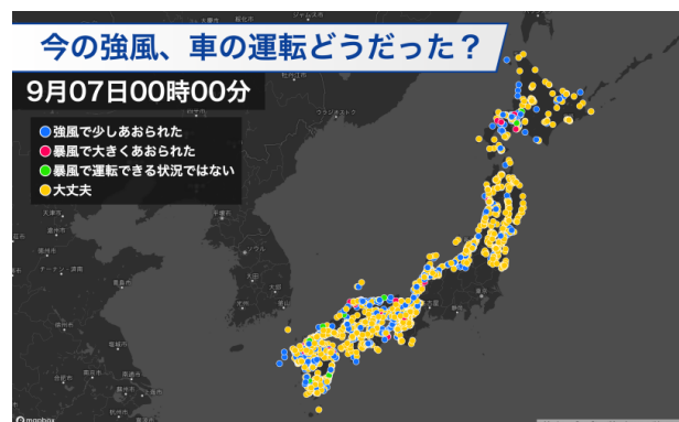
2022年9月7日に実施した風に関する調査