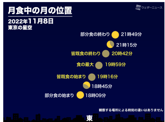
11月8日 月食の動きと時刻 (東京)

部分食の始まり 18時09分頃 皆既食の始まり 19時16分頃 皆既食の最大 19時59分頃 皆既食の終わり 20時42分頃 部分食の終わり 21時49分頃