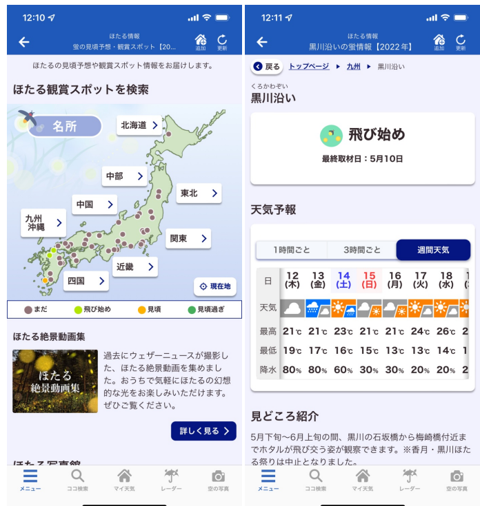
『ほたる情報』トップページ