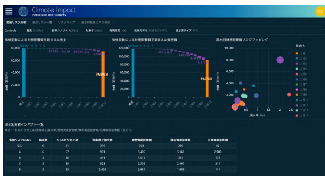
気候変動リスク分析サービス「Climate Impact」