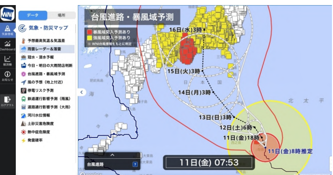
リスクの回避・軽減を支援する「ウェザーニュース for business」