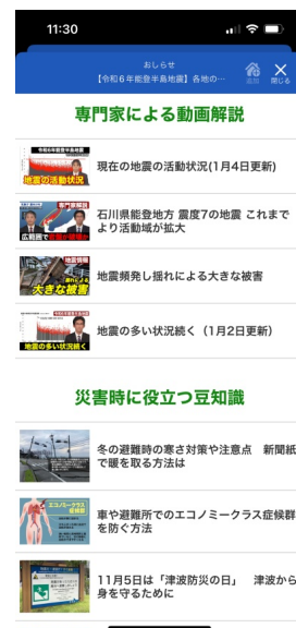
専門家による動画解説 災害時に役立つ情報も掲載

一日でも早い復旧を心よりお祈り申し上げるとともに、当社は様々な形で被災した皆さまや被災地への支援を継続してまいります。今後、被災地への人的支援も含めた追加支援も検討いたします。