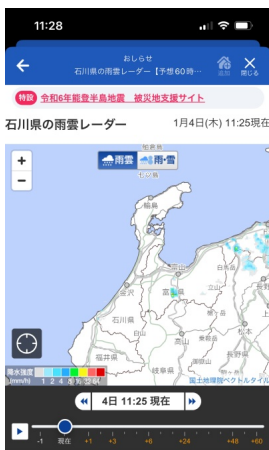
被災地周辺の 雨雲レーダー