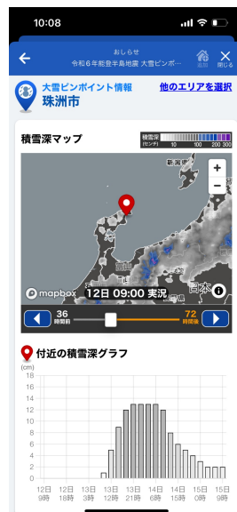
積雪のピンポイント予報 (画像は石川県珠洲市)