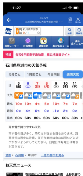
各地のピンポイント天気予報 (画像は石川県珠洲市)