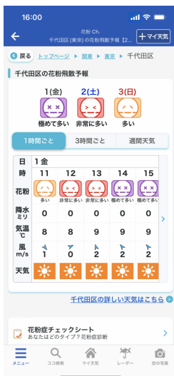
図 1 ピンポイント飛散予報

ウェザーニューズアプリでは、ポールンロボの観測データを活用し、花粉症対策に役立つ、どこよりも細かい花粉情報を配信しています。花粉の飛散予報が1時間ごと・3時間ごとの時系列と、1週間先まで確認できるピンポイント飛散予報(図 1)や、ポールンロボの観測によるリアルタイム飛散状況(図 2)などが利用可能です。花粉の飛散量は時間帯によって変化するため、同じ一日の中でも花粉症の症状に強弱が出ることがあります。飛散量の時間変化をより詳細に把握することで、花粉の多い時間を避けたり、飛散量に合わせて対策を強化したりすることが可能になります。さらに、周辺の花粉症の方の症状の程度や(図 3)、自分の花粉症の症状の特徴を診断できる機能(図 4)も提供します。