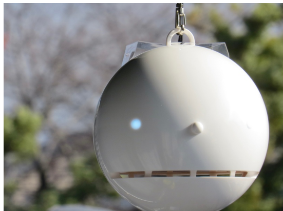
花粉観測機「ポールンロボ」

花粉の観測方法には、1 日 1 回ガラス板に付着した花粉を顕微鏡で数えるダーラム法と、機械による花粉の自動観測の 2 種類があります。ダーラム法による花粉観測はスギ・ヒノキの花粉を見分けられるという利点がありますが、観測に多くの時間と労力がかかる上に 1 日単位での飛散量しか把握できません。また、観測場所も全国に約 150 か所程度と限られています。一方、花粉の自動観測は花粉の種類は見分けられないものの花粉の飛散状況をリアルタイムで把握できます。花粉は気象条件によって飛散量や飛散エリア・時間帯が変化するため、飛散状況を時間的にも空間的にも詳細に把握することが重要です。