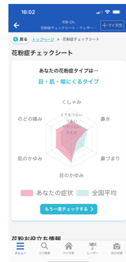
図 4 花粉症チェックシート