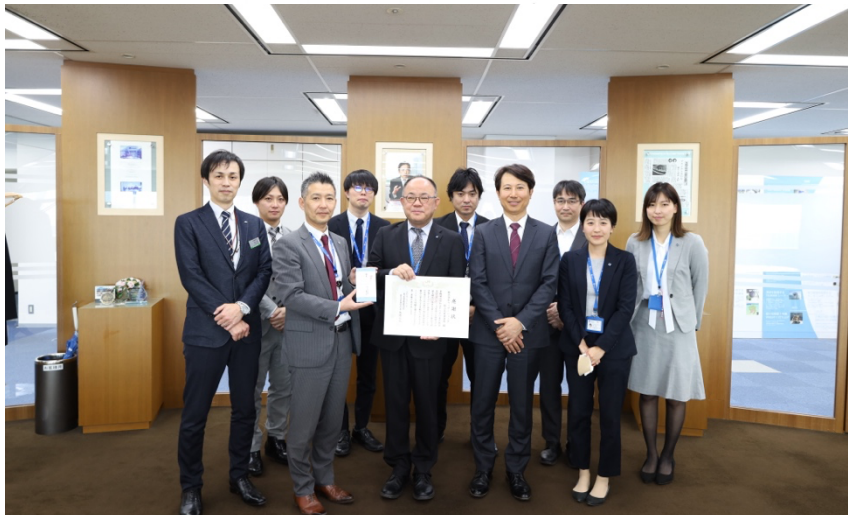
授与された感謝状