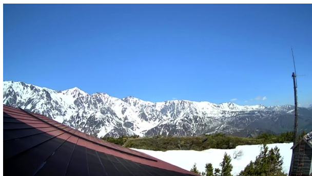
八方池山荘 ライブカメラ映像イメージ

さらにこの 1 年で、山小屋やスキー場などへの設置も進んでいます。昨夏、長野県の蓼科山頂ヒュッテと八方池山荘にソラカメが設置されました。また、今冬には 9 か所のスキー場に設置され、アプリ上で公開されています。山小屋からの見通しや、スキー場の積雪の様子をリアルタイムかつ映像で確認できるため、登山前の装備や安全確認はもちろん、山からの眺望や雪のコンディションの確認などにも役立てられています。今後も様々な場所での活用が期待できます。