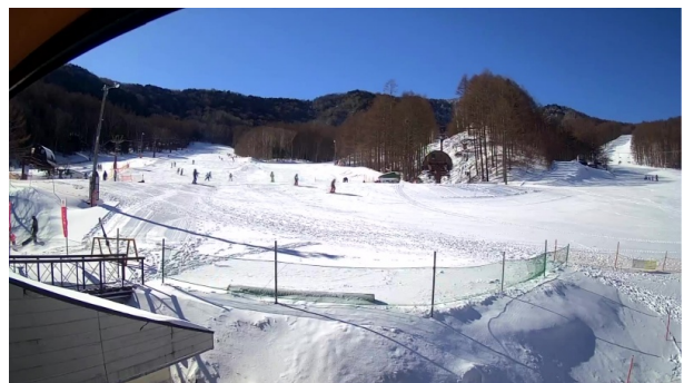
八千穂高原スキー場 ライブカメラ映像イメージ