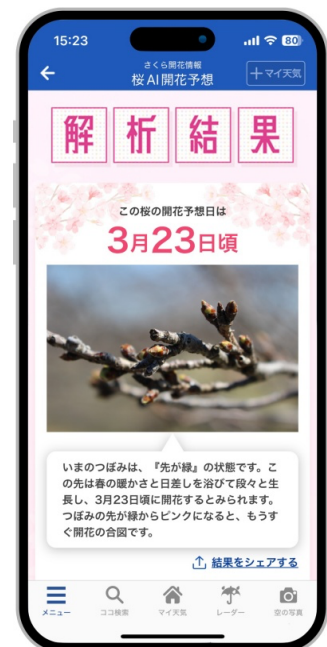
つぼみの開花予想日を表示