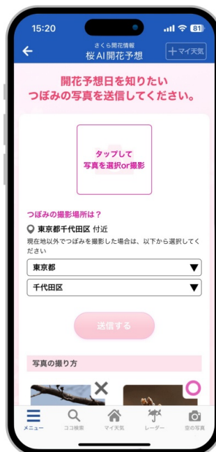
つぼみの写真と撮影場所を送信